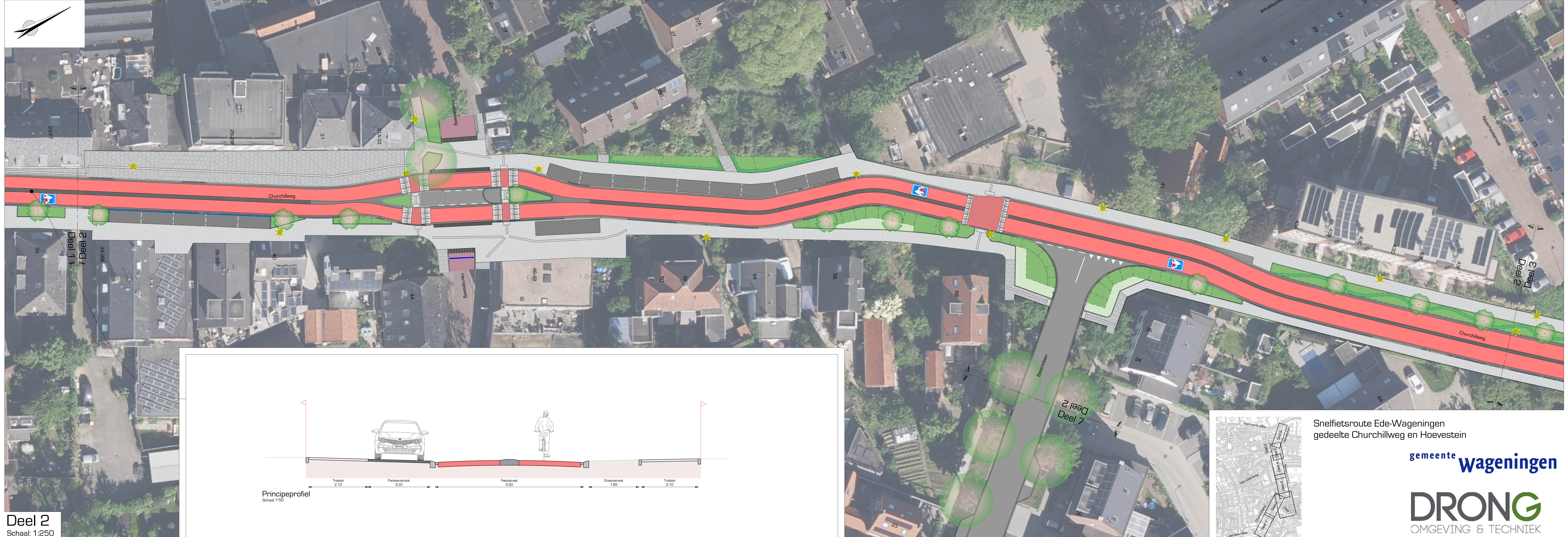
Deel 2 Schaal: 1:250